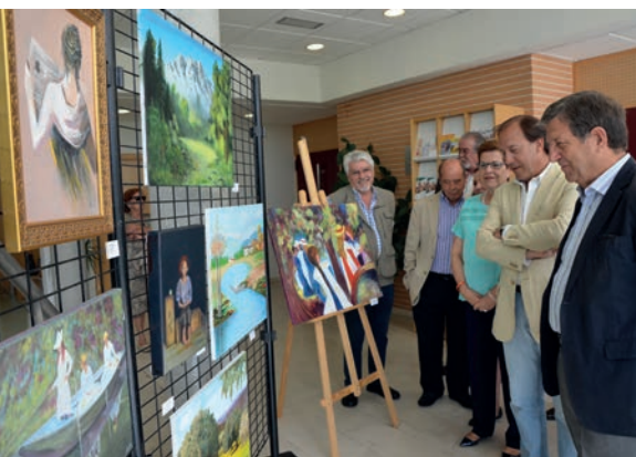
El alcalde visitando una exposición de pinturas realizadas por mayores.

Los participantes van a ser clasificados por grupos y les serán prescritas distintas actividades físicas en función de sus necesidades y posibles patologías. Estas se realizarán durante un año en periodos de tres meses. Una vez finalicen, se realizará una evaluación con el fin de conocer de qué manera el ejercicio físico ha contribuido a mejorar su calidad de vida.