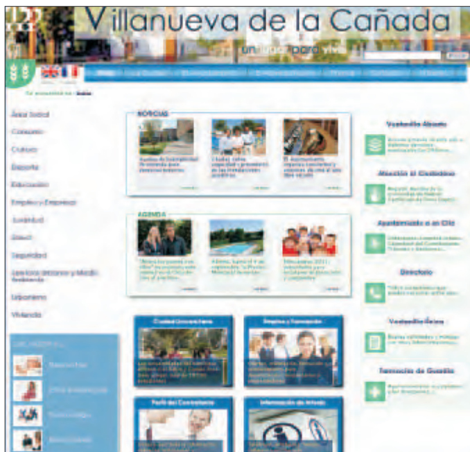
Imagen de la página de inicio de la nueva web del Ayuntamiento.

El Ayuntamiento acaba de poner en marcha la nueva web municipal. El objetivo es hacer de esta herramienta informática uno de los principales cauces de comunicación con ciudadanos y empresas pero sobre todo un canal de atención al público rápido y eficaz. De hecho, a través de la nueva web, se podrán realizar trámites para los que hasta ahora era necesario desplazarse a las dependencias municipales.