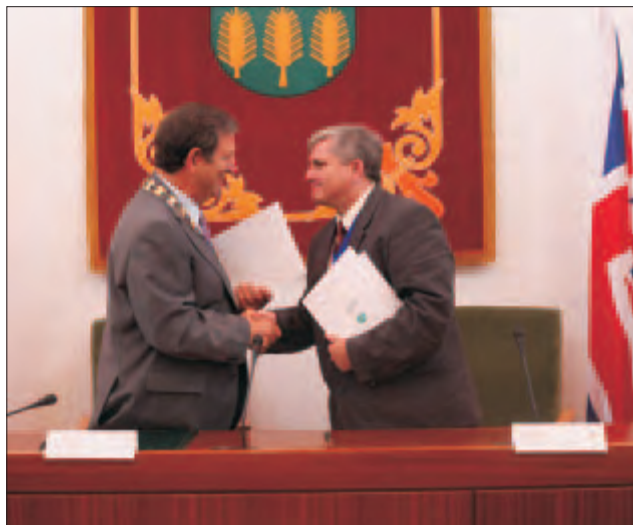
Los regidores de ambos municipios firmaron el acuerdo en Villanueva de la Cañada.

Las gestiones realizadas por la Asociación Cultural de Hermanamientos ( www.achvillanueva.org ) con su ho-