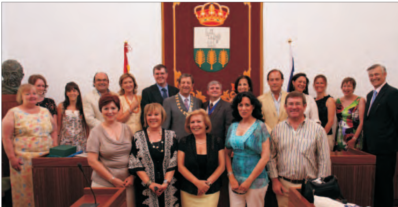
Los dos alcaldes, acompañados por concejales y representantes de las asociaciones de hermanamientos de ambos municipios.

La ciudad inglesa de Royston forma parte ya de la historia reciente de Villanueva de la Cañada. Les une, desde el pasado 27 de junio, un Convenio de Hermanamiento pero sobre todo un proyecto común, de cooperación, que ambas Corporaciones Municipales han decidido poner en marcha con el apoyo y respaldo de las asociaciones de hermanamientos de ambas ciudades.