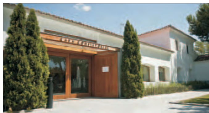
Los ciudadanos, si lo desean, pueden realizar trámites sin desplazarse al Ayuntamiento, a través de Internet.

Gestión Tributaria: Consulta de la deuda tributaria, Consulta