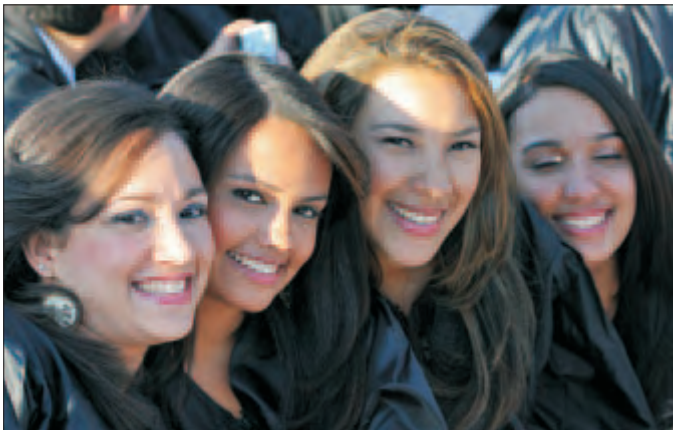
Varias alumnas, en el acto de graduación de la Universidad Camilo José Cela.