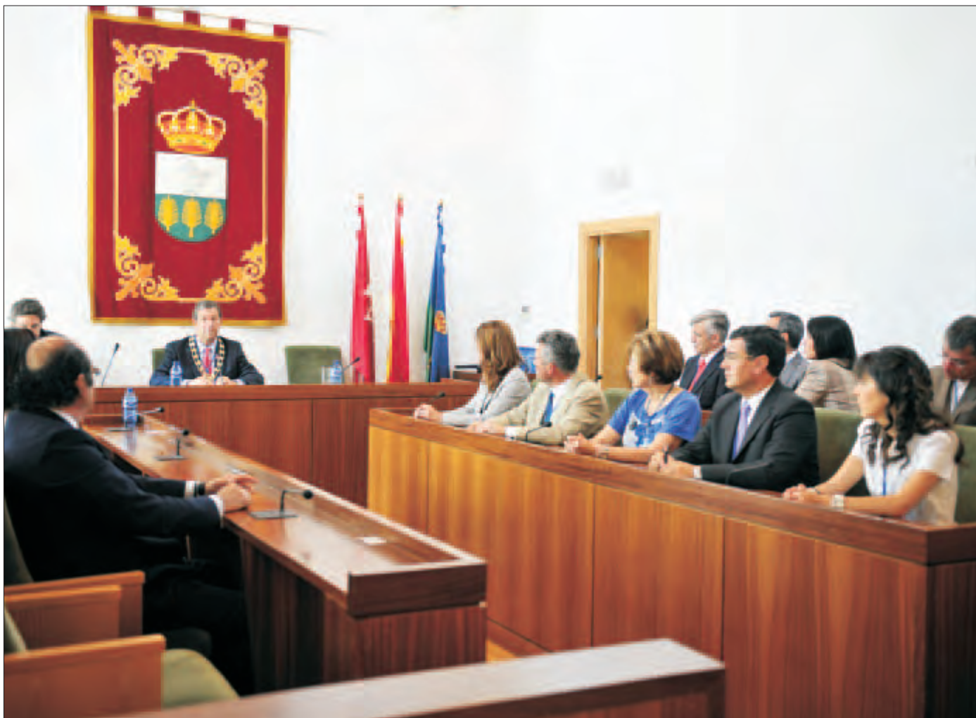
Imagen del discurso de investidura del alcalde, tras tomar posesión de su cargo, el pasado 11 de junio.