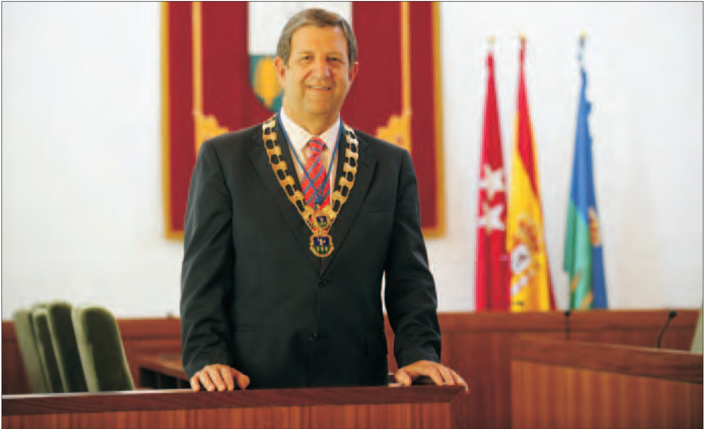
El alcalde, en el Salón de Plenos de la Casa Consistorial.