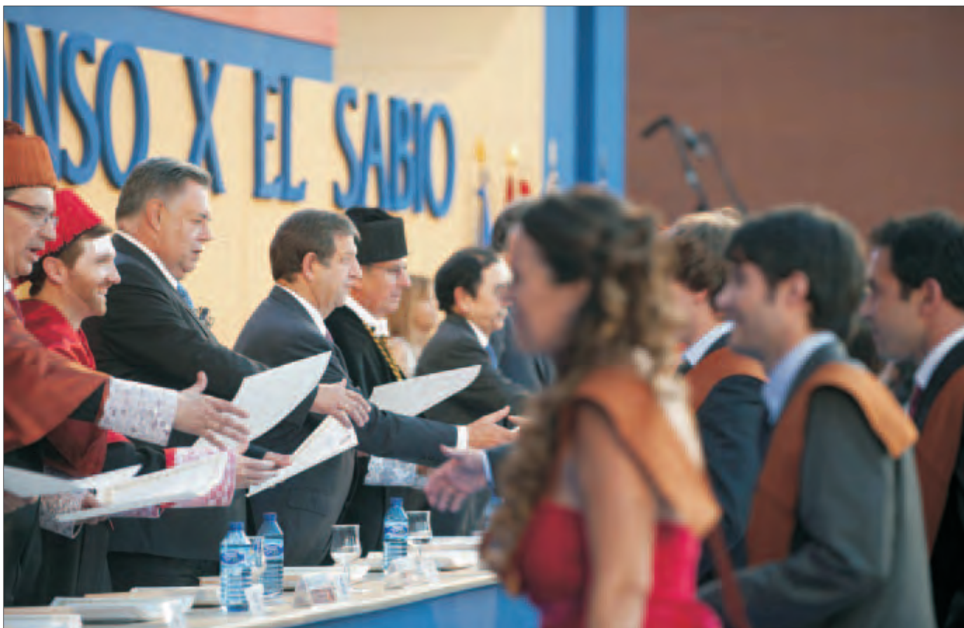
Alumnos de la UAX, que han culminado con éxito su titulación en este último curso, durante el acto de graduación celebrado en el campus, el pasado mes de junio.